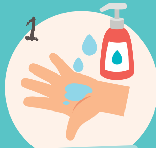
1 Benutze Seife!