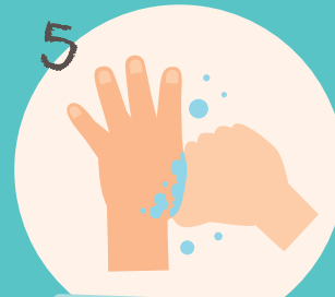
5 ... die Daumen