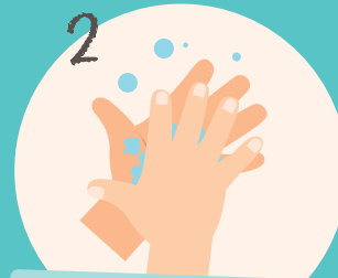
2 Reibe die Innseiten der Hände gut ein