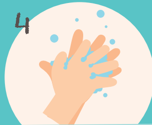
4 ... die Zwischenräume der Finger