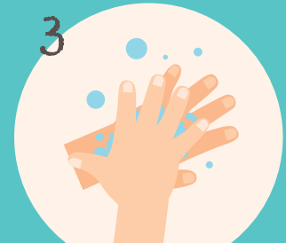
3 ... die Rückseite