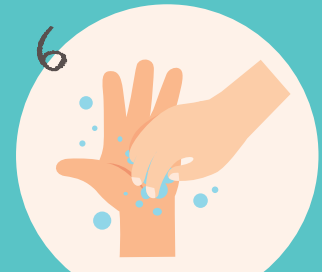
6 ... die Fingernägel